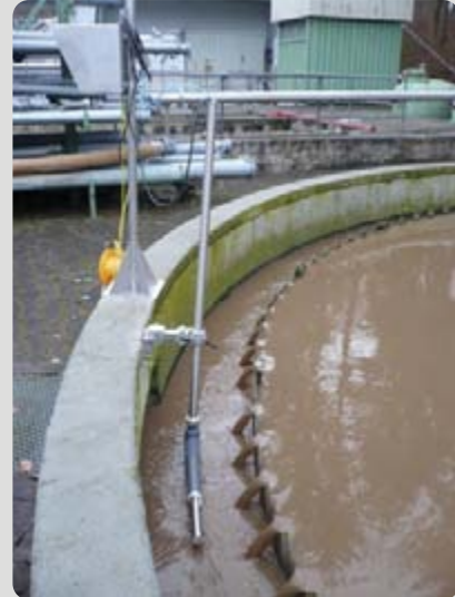
nitro::lyser in Belebungsbecken